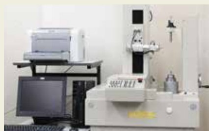
CNC全自動歯車試験機 CNC Automatic Gear Measuring Machine