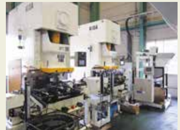
110トンプレス自動ライン Automated press line 110tons