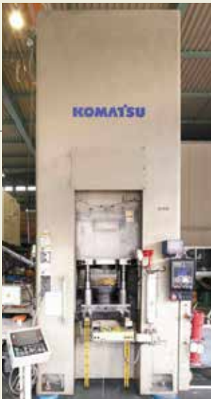
冷間鍛造プレス 630トン Cold Forging press 630tons