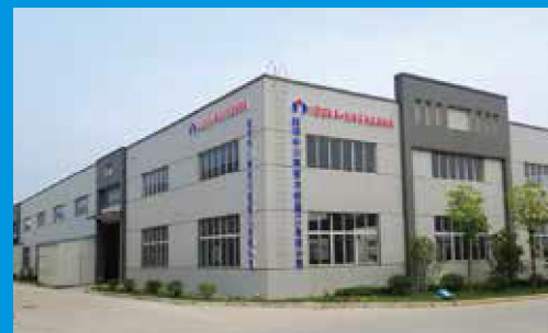
飯塚中川精密冷鍛(鎮江)有限公司 IIDZKA-NAKAGAWA PRECISION COLD FORGING(ZHENJIANG) CO.,LTD.