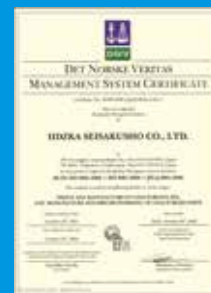
ISO9001 〈品質マネジメントシステム〉認証取得

Realizing the above policies, We supply higher standards and reliable products to the customers.