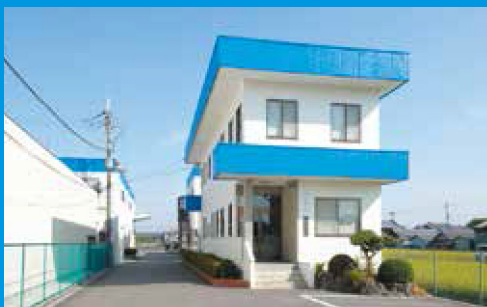
本社 Head Office

Overseas factory : IIDZKA-NAKAGAWA PRECISION COLD FORGING(ZHENJIANG) CO.,LTD. No.1 Tong Hong Road, Zhenjiang New Economic Development Zone, Science/Technology Park No.8 Zhenjiang, Jiansu (212132) China. TEL:(86)-5111-8086-0360 FAX:(86)-5111-8086-0369