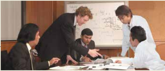
開発ミーティング Development meeting