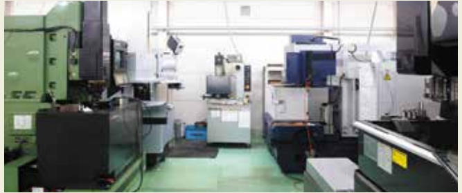
NC放電加工機 NC electro discharge machine