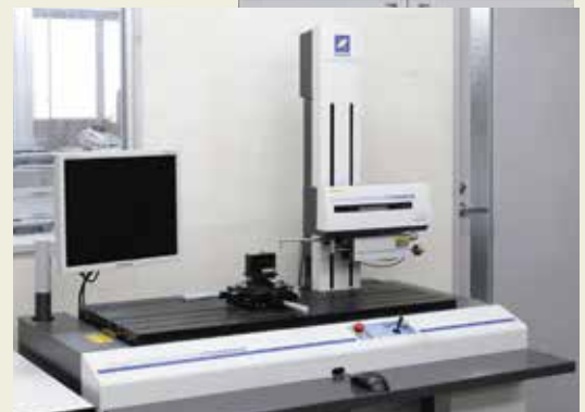
形状測定機 Form measurement equipment