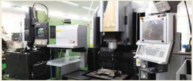
金型製作設備 Die building facilities