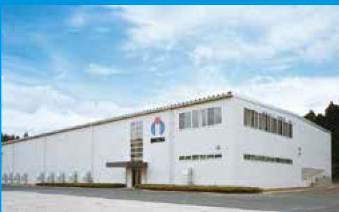
鹿児島工場 Kagoshima Factory