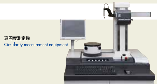
真円度測定機 Circularity measurement equipment