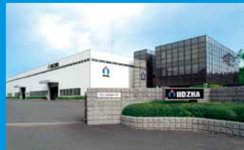
針工場 Hari Factory