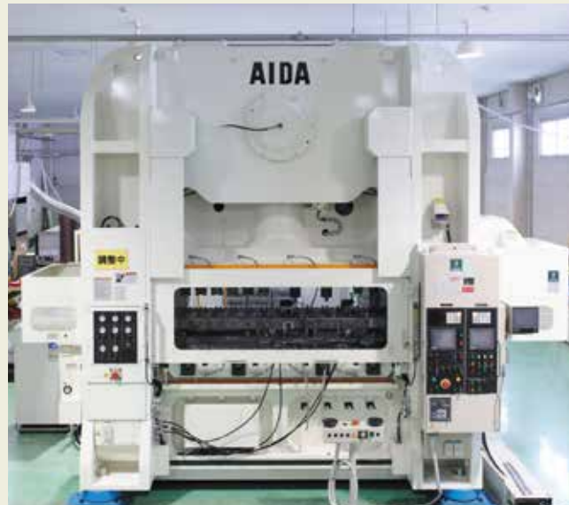
精密成形プレス 300トン Ultimate Precision Forming press 300tons