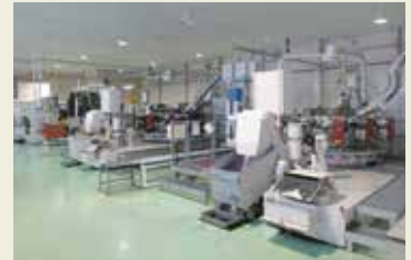
スイス製 ロータリー式トランスファーマシン Swiss made rotary transfer machine