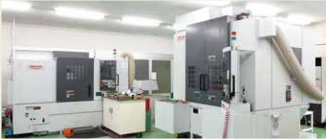
金型製作設備 Die building facilities