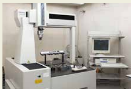
三次元測定機 3D measurement equipment