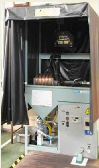
磁粉探傷装置 Magnetic measurement equipment